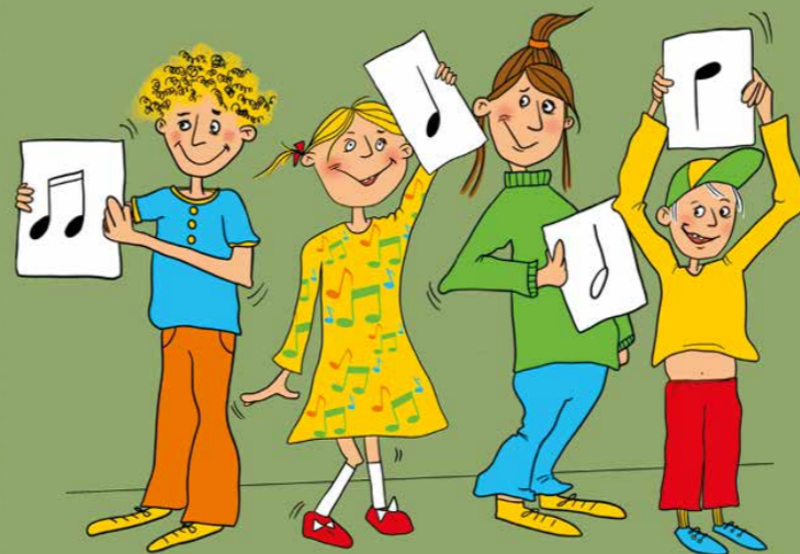
ILLUSTRATION ANNA NALIN

Produktionen genomförs av GotlandsMusiken i samverkan med Region Gotland, Kulturskolan Gotland och Roxy för barn och unga.